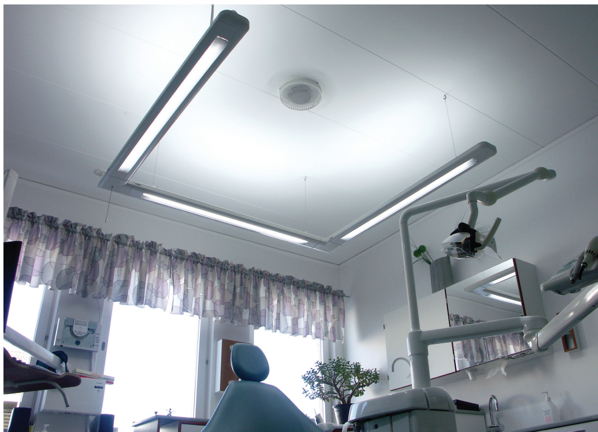
Armatursystem med ljusoptik anpassad för tandvården.